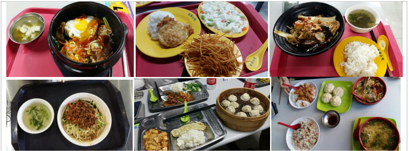
그림2. 학생식당 메뉴