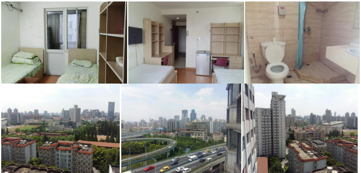
그림6. 기숙사 외/내부

· 각 방마다 에어컨/난방기, 냉장고, TV, 옷장, 책상, 침대가 있습니다. 방은 좁은 편이지만 지내다 보면 금방 적응하여 크게 불편한 점은 없었습니다. 방 구조를 바꿔서 공간을 넓히면 좀 더 쾌적하게 생활 할 수 있습니다. 그리고 옷장이나 침대 밑 서랍에는 옷을 충분히 넣기에 부족해서 행거를 사는 친구들도 있습니다. 베란다나 복도에 있는 건조대가 높아서 여자친구들이 사용하기에는 다소 불편했습니다. 학교 매점에서 빨래 거는데 사용하는 막대기를 사면 편하게 걸 수 있습니다. 건조대를 사서 복도에 말려도 괜찮을 것 같습니다. 다행히도 빨래를 훑쳐가거나 하는 경우는 없었습니다. 기숙사는 18층까지 있고 1학기에는 5층에 살아서 주로 계단을 이용했습니다. 2학기에는 17층에 살아서 엘리베이터를 기다리는 것이 조금 힘들었습니다. 방에서는 벌레도 종종 나오는데 살충제나 소독을 하시면 괜찮을 듯 합니다. 5층에서는 한 학기 동안 벌레를 보지 못했는데 17층에 살 때는 습하고 벌레도 많아서 초반에 고생을 좀 했습니다. 사무실에 말하면 방 소독을 해주시니 소독을 부탁 드리거나 살충제를 사셔서 처리하시면 될 것 같습니다.