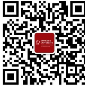
그림5. ICES QR코드 (웨이신 계정:dhu-ices)

동화대는 외국인 학생이 정말 많습니다. 그래서 좋은 점도 있지만 중국 학생들과 교류하고 사귄 수 있는 기회가 적습니다. ITALK라는 언어교환 프로그램에 등록하면 중국 학생과 매칭해 주거나 직접 그룹을 만들어 활동할 수 있습니다. 보통은 그룹을 만들고 활동을 하지 않는 경우가 많습니다. 그래서 대부분의 유학생들은 유학생끼리 사귄 수밖에 없습니다. 다행히도 저는 담당자 분께서 중국 학생과 매칭을 해 주셔서 일년 동안 중국 친구와 교류할 수 있었습니다. 덕분에 다른 중국 친구들도 많이 만나고 중국 학생들이 공부하는 교실에서 같이 공부도 해보고 여러 곳에 가 볼 수 있었습니다.