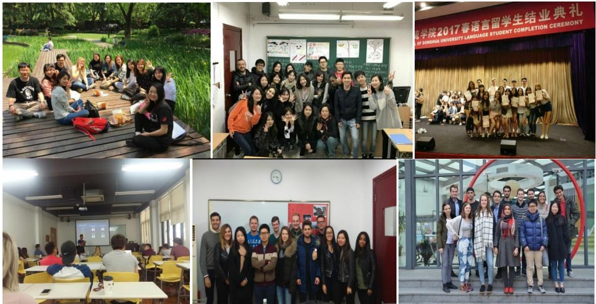
그림5. 수업 및 활동 사진